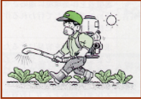
④ 農薬等の散布作業に従事