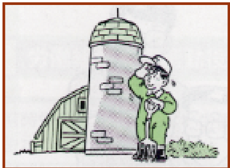
③ サイロ、むろ等の酸素欠乏危険場所での作業に従事

なお事業場の規模を判断する上で、農家の集団が共同で作業を行ういわゆる「地域営農集団」又は農事組合法人において、年間の農業生産物総販売金額が三〇〇万円以上又は経営耕地面積が二ヘクタール以上の規模であれば、要件を満たすとされています。