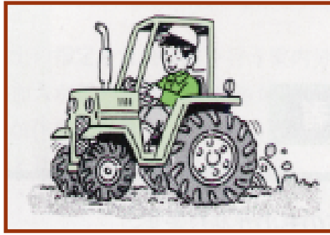
① 動力駆動による機械を使用する作業に従事