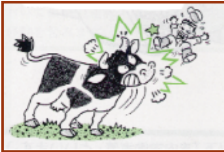
⑤ 牛、馬、豚に接触し、又は接触する恐れのある作業に従事